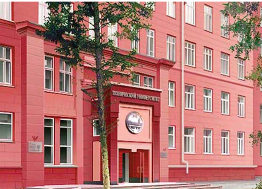
Новосибирский государственный технический университет

Формирование языковой компетенции – основная задача учебного процесса. Для ее выполнения преподаватель выбирает различные методы, подходы, технологии, приемы и средства обучения. Однако в связи с возросшей ролью иностранного языка в современном обществе на смену традиционным методам обучения иностранному языку пришли методы активного обучения.