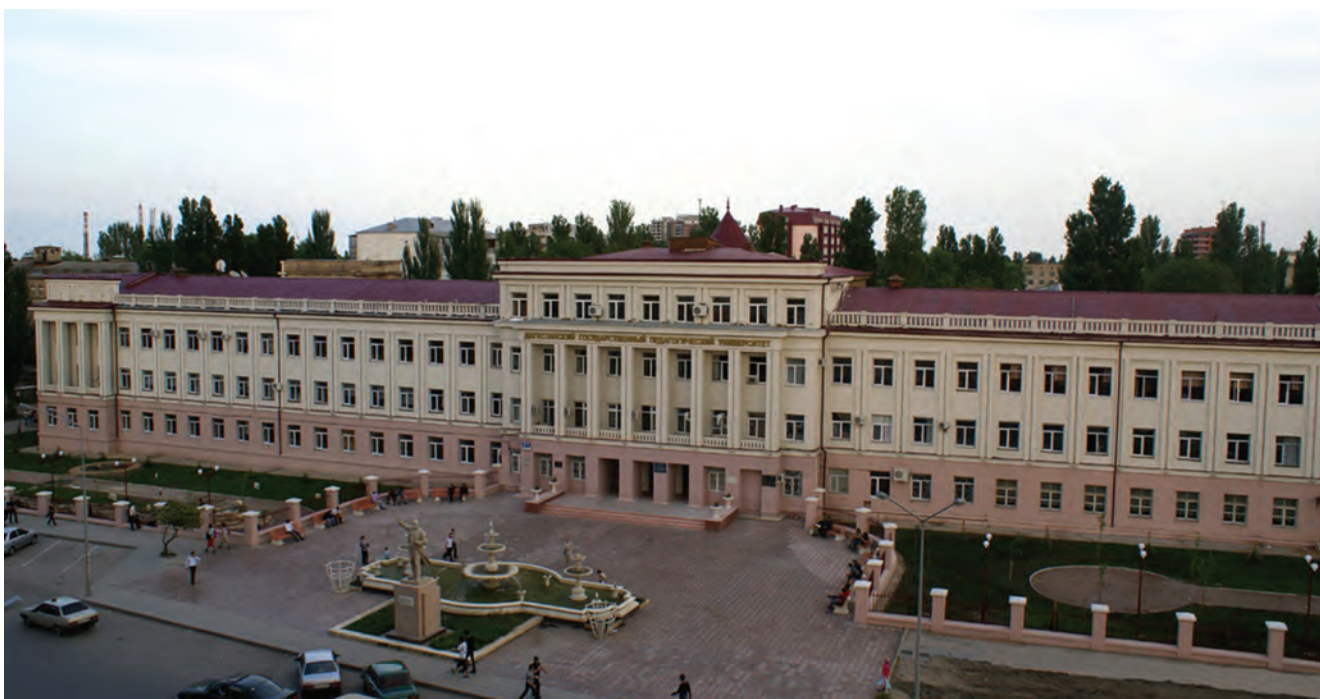
Дагестанский государственный педагогический университет

Проблема формирования коммуникативной компетентности рассматривается в исследованиях многих психологов, социологов, лингвистов, педагогов. Практически во всех научных трудах подчеркивается, что коммуникация – это сложный и многоплановый процесс, выступающий и как обучение, и как средство передачи форм культуры, общественного опыта, языка, речи.