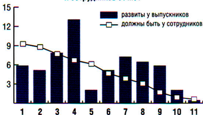
Рисунок 3. Мнение работодателей о наиболее развитых и необходимых компетенциях выпускников и сотрудников УГМУ.

Важнейшим показателем качества подготовки специалистов вуз считает востребованность выпускников на рынке труда. Заявок на них администрация получает почти в два раза больше, чем ежегодный выпускаемый контингент. В 2008 году в структуре университета создан центр содей-