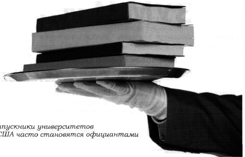
Выпускники университетов в США часто становятся официантами

Заметьте, что так же думает и британское общество. Ещё в Алма-Ате мой частный ученик, английский юрист высокой квалификации, лет около 35, сказал мне, что в университете он изучал не юриспруден-