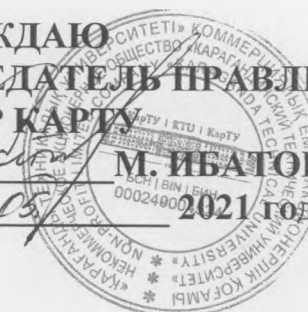
ГРАФИК УЧЕБНОГО ПРОЦЕССА КАРАГАНДИНСКОГО ТЕХНИЧЕСКОГО УНИВЕРСИТЕТА на 2021/2022 учебный год (очная сокращенная форма обучения)