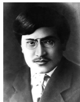
Әлімхан Әбеуұлы Ермеков (1891-1970)