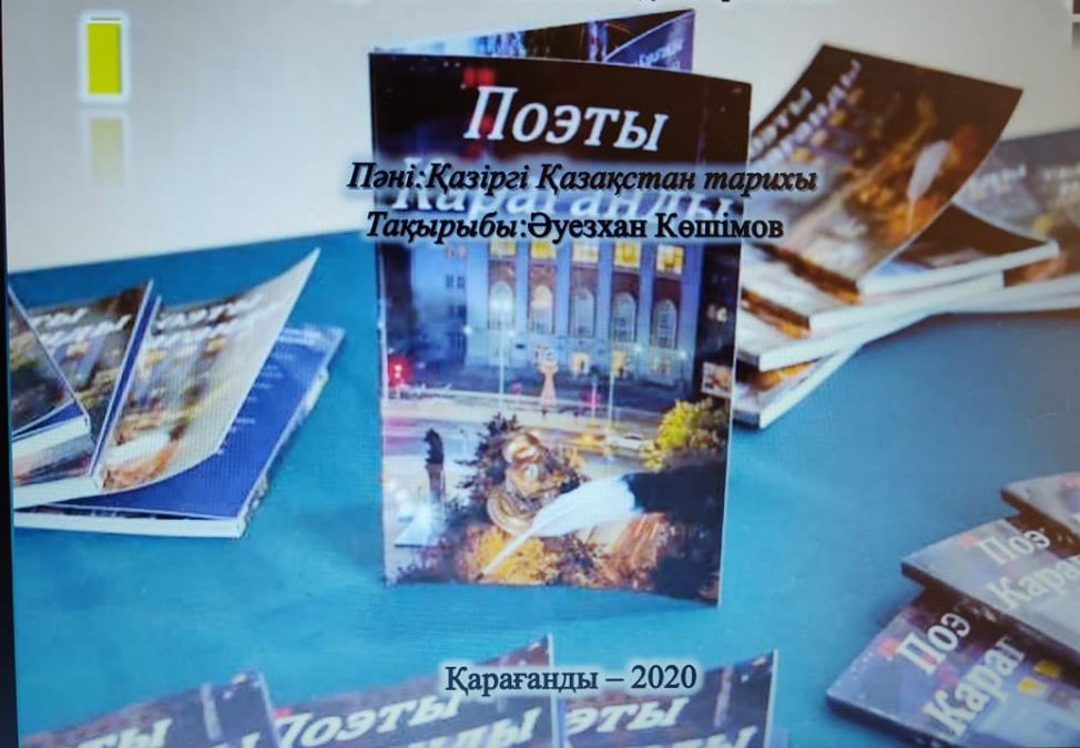
Қарағанды – 2020