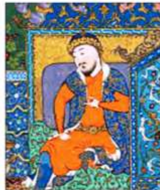
парсы патшасы Джемшид

Бұл мейрам туралы көптеген аңыздар бар. Соның бірі: өз елін аралап жүрген парсы патшасы Джемшид Әзірбайжан деген жерге тоқталыпты. Ол уәзірлеріне күнгей жаққа қаратып, үлкен тақ орнатуды бұйырған екен. Күн сәулесімен шағылысқан тақ айналаға ерекше нұр шашыпты. Осыдан соң, ел бұл күнді жаңа жыл есебінде тойлауды дәстүрге айналдырыпты.