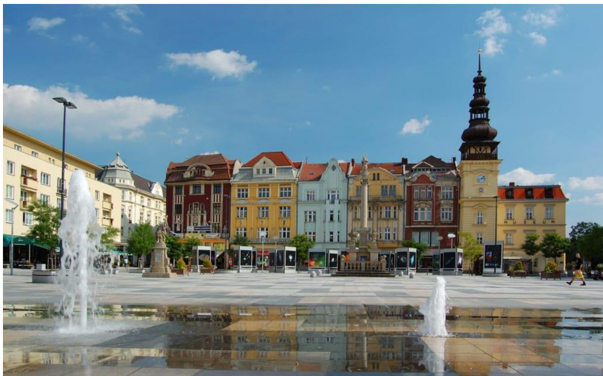
Острава қаласының алаңы