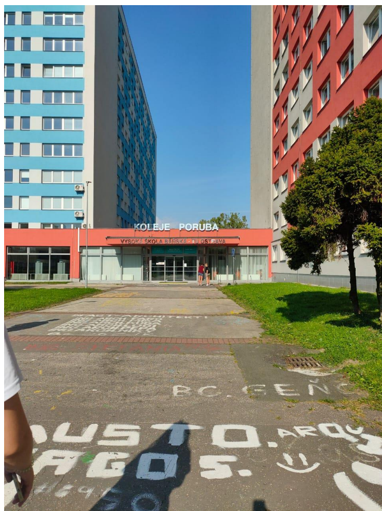
Острава техникалық университетінің жатақханасы