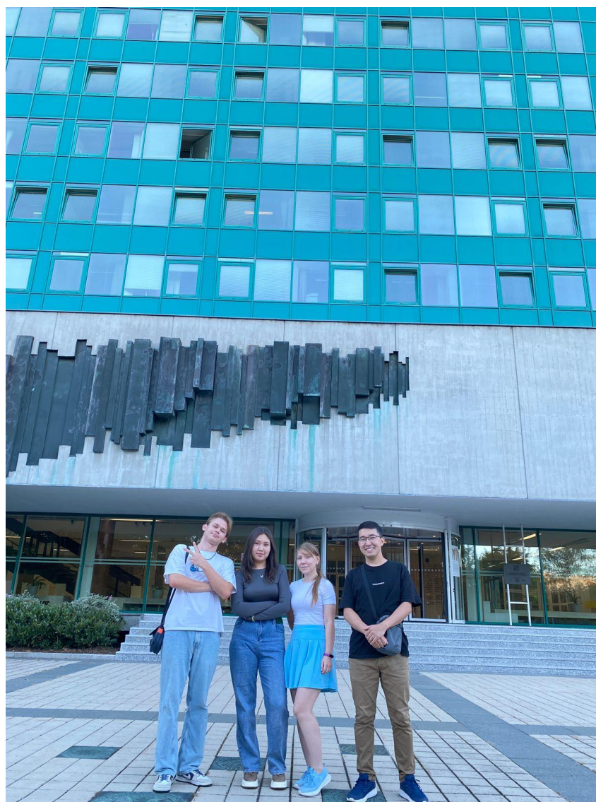
Обучающиеся кафедры «Строительные материалы и технологии» в Остравском техническом университете перед главным корпусом университета