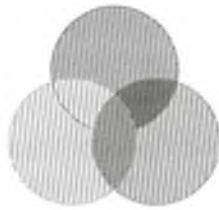
Рис. 1. Описание рисунка

Основной текст статьи. Основной текст статьи. Основной текст статьи. Основной текст статьи. Основной текст статьи. Основной текст статьи. Основной текст статьи.