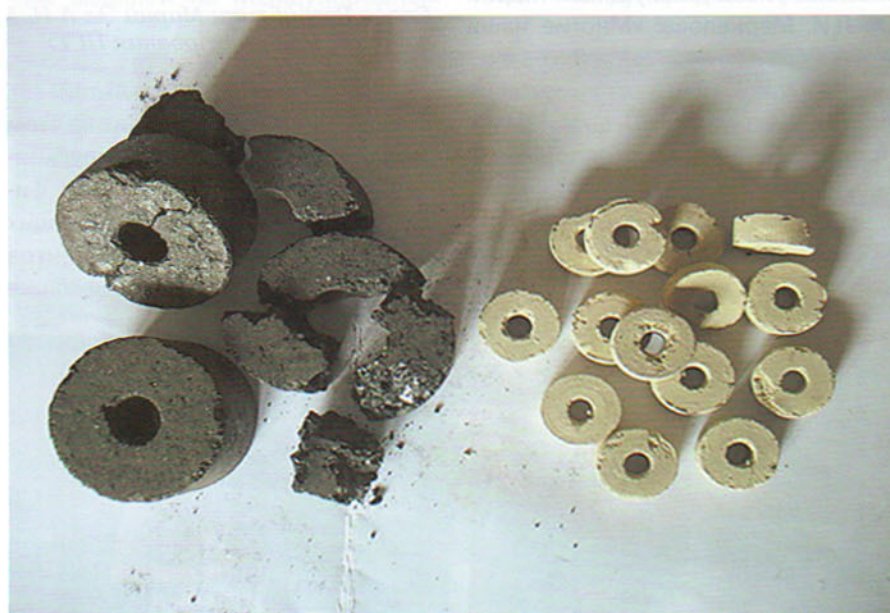
Коксовые брикеты из недожега

М етодика позволяет получать из переработанной золы золото, платину, а также несколько разновидностей стройматериалов: кирпич, кровельную черепицу, утеплитель, стеновые блоки, брусчатку. Внедрение технологии позволит создать прибыльное и безотходное производство. Научная группа установила, что в среднем в каждой тонне отходов горючего камня, сжигаемого в электростанциях и котельных Дальневосточного региона, содержится 2,5 г золота. По промышленным меркам это средний показатель. На сегодняшний день основные богатые рудные месторождения выработаны, и при содержании 2–3 г золота на тонну