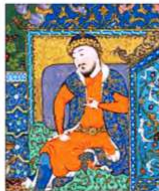
парсы патшасы Джемшид

Бұл мейрам туралы көптеген аңыздар бар. Соның бірі: өз елін аралап жүрген парсы патшасы Джемшид Әзірбайжан деген жерге тоқталыпты. Ол уәзірлеріне күнгей жаққа қаратып, үлкен тақ орнатуды бұйырған екен. Күн сәулесімен шағылысқан тақ айналаға ерекше нұр шашыпты. Осыдан соң, ел бұл күнді жаңа жыл есебінде тойлауды дәстүрге айналдырыпты.