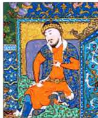
парсы патшасы Джамшид

Бұл мейрам туралы көптеген аңыздар бар. Соның бірі: өз елін аралап жүрген парсы патшасы Джамшид Әзірбайжан деген жерге тоқталыпты. Ол уәзірлеріне күнгей жаққа қаратып, үлкен тақ орнатуды бұйырған екен. Күн сәулесімен шағылысқан тақ айналаға ерекше нұр шашыпты. Осыдан соң, ел бұл күнді жаңа жыл есебінде тойлауды дәстүрге айналдырыпты.