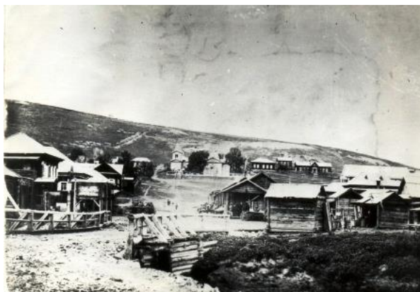
Базар аумағы, 1990 ж.

1939-1940 жылы үлкен Зырян құрылысы бойынша жобалар ғылыми-зерттеу жұмыстарымен ресімделеді. Қаланың қарқынды дамуы басталды.