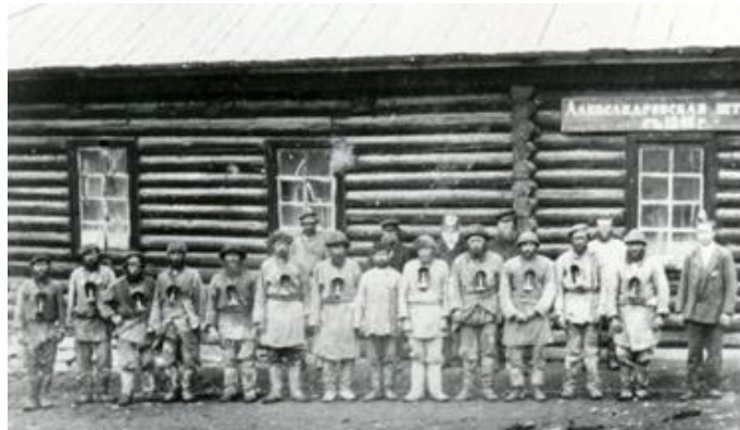
Зырян кенішінің кенжұмыскерлері-бергайлері, 1846ж.

«Кабинет» кезеңінде (114 жыл) кеннің 1360 мың тоннасы өндірілді, осының ішінен 956 мың тонна сұрыпталды. Орташа жылдық табыс 12 мың тоннаны құрады.