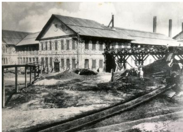
Сілтісіздендіру зауыты, 1900ж.

1891-1892 жылдары алғаш рет Ресейде сульфидтік кендерді ылғалды (химиялық) әдіспен байытатын сілтісіздендіру зауыты салынды.