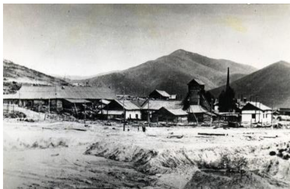
Зырян кенішінің ескі өнеркәсіптік аймағы

Зырян өндіруге жоғары сынып кенін өндіру жаңа техникалық шешімдерді тартты және жылдам қайта жарактандыру ықпал етті. Алтайда алғаш рет, кеніште кенді көтеру Галия тізбегі және сым арқанмен сыналды.